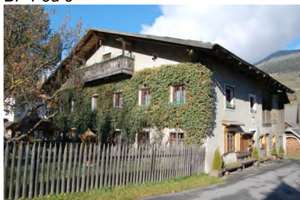
BP Ped 2/1