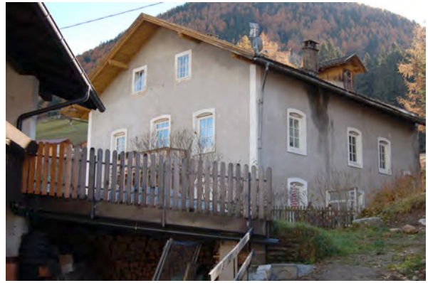
BP Ped 32 Nordfassade