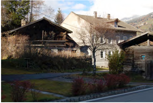
BP Ped 32