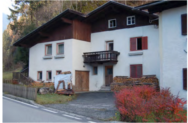
BP Ped 29/1