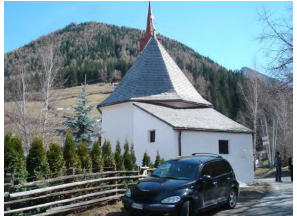
BP Ped 1