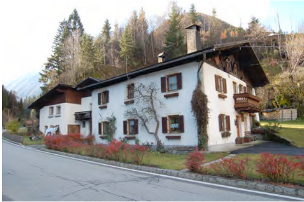
BP Ped 29/2