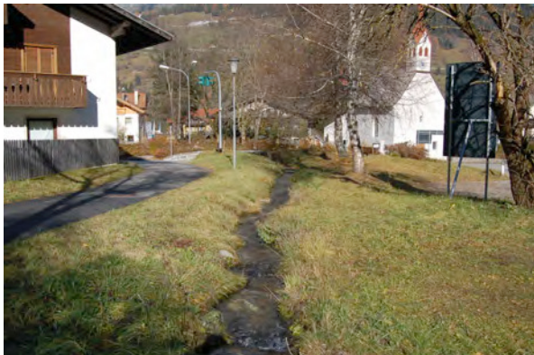
Kanal – Canale