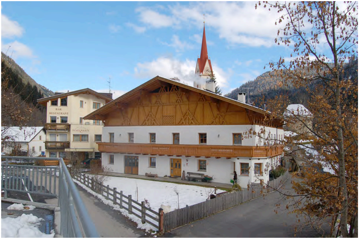
BP Ped 139