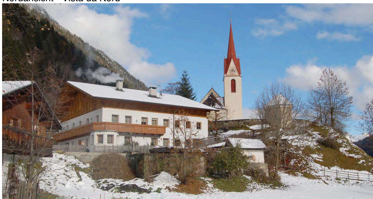
BP Ped 596