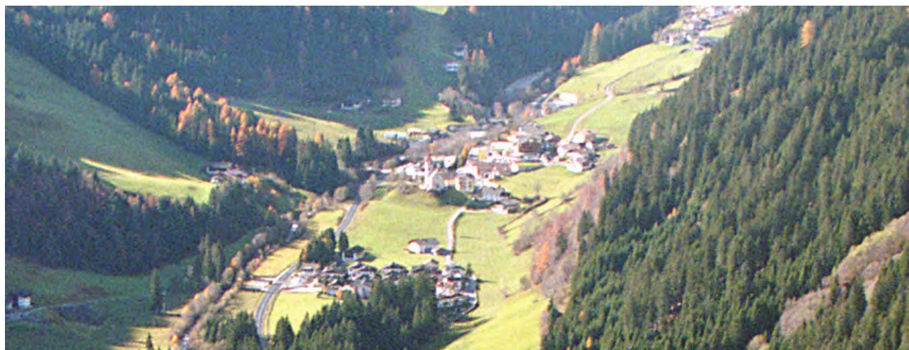
Luftaufnahme – Foto aerea