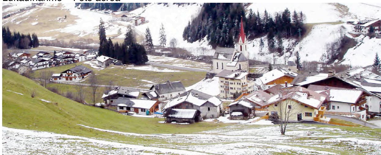
Nordansicht - Vista da Nord