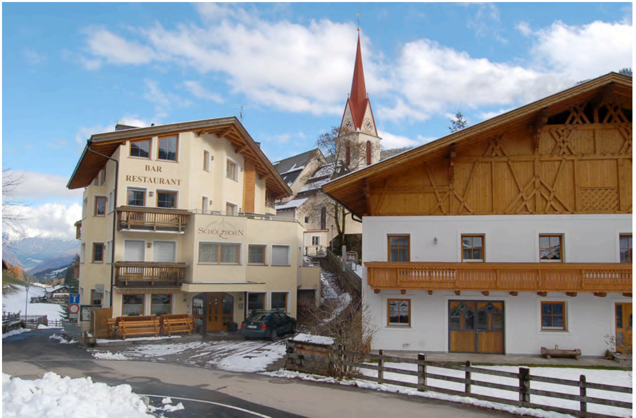
BP Ped 139